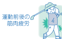
運動前後の 筋肉疲労

運動前後の筋肉疲労、打撲、捻挫、頭痛、歯痛、肩凝、凍傷、ロイマチス、神経痛、関節炎、毒虫咬傷、皮膚癌痒症、咽喉痛、感冒性関節炎