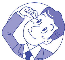
コンタクトレンズを装着 したまま点眼できます