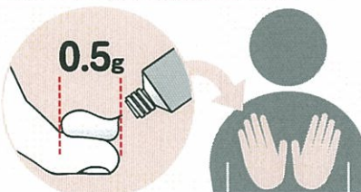
大人の手ひら2枚くらいの広さに伸ばします

チューブから、大人の人差し指の第一関節の長さくらい（約0.5g）を出した場合、大人の手のひら2枚くらいの広さに伸ばして塗ります。これを目安として、患部の広さと比較して使用量を決めます。