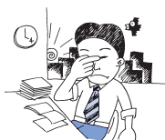
書類を読んだ時や 読書のあとの目の つかれに