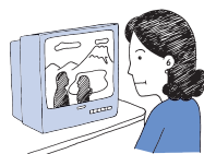
テレビのあとの 目のつかれに